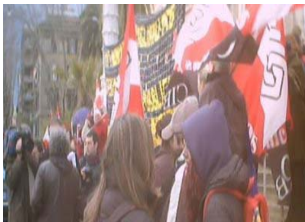
Sciopero del 1° marzo 2004