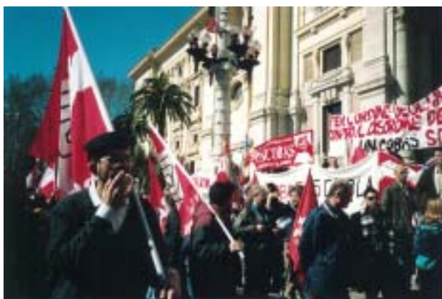
1° marzo 2004: l'UNicobas Scuola sciopera contro la Legge Moratti, mentre i Confederali e lo SNALS aspettano o sono conniventi!!

L'unica nota positiva di questo documento degno di essere cestinato è che Cgil,Cisl.Uil e Snals, dopo tanta