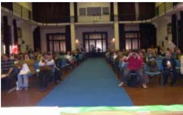
Convegno 12.5.2004 ITIS Galilei Roma

la chiama di nuovo così: non si parla più di educazione motoria, a dimostrazione che trattasi davvero di un grande pedagogista! - in funzione subalterna, aggiuntiva ed opzionale!