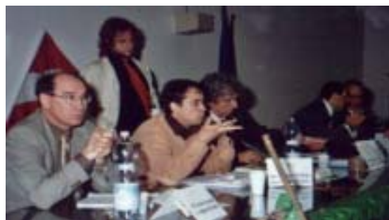
Un'altra foto del convegno organizzato il 12 maggio 2004

Un altro aspetto, a mio avviso negativo è l'eccessiva disciplinizzazione (sia nella scuola primaria che nella secondaria di primo grado), che comporta la riduzione del ruolo formativo delle discipline ad una dimensione nozionistica e contenutistica. Non si possono presentare, fin dalla prima elementare, gli Obiettivi specifici di apprendimento sotto forma di elenchi dettagliati disciplina per disciplina, perché così, da una parte, si esclude la dimensione trasversale tra le discipline che, soprattutto nella scuola di base, riveste un ruolo fondamentale nella costruzione di atteggiamenti mentali, di categorie logiche, di competenze, sia sul piano cognitivo che su quello sociale - relazionale, dall'altra si nega esplicitamente la delicatezza di un passaggio progressivo dalla Scuola dell'Infanzia ad un ordine superiore.