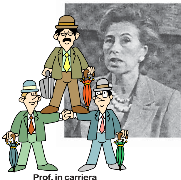
Prof. in carriera

E’ dalla scuola Media che si coglie il nocciolo duro della controriforma. Da qui si dipana il doppio percorso formativo, punto d’arrivo definitivo. Un settore di serie “A”, già depauperato in sé, ma che sbocca ancora nell’Università ed un vero e proprio segmento differenziale di massa che si arresta alla formazione professionale, cui destinare la maggior parte del corpo studentesco: il 22,3% che ora afferisce agli istituti professionali e buona parte di quanti frequentano i tecnici (36,7%), più i “fuorusciti di risulta” che la struttura stessa della nuova scuola scaricherà dai licei.