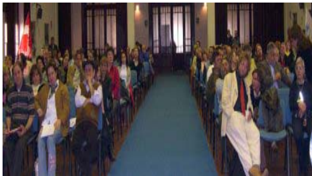
La sala gremita dell'ITIS Galilei a Roma in occasione dell'ultimo convegno organizzato dall'UNICobas Scuola

da utilizzare da parte di supposti “utenti” consumatori (siano essi gli studenti o le famiglie), ma un valore da far proprio ed accrescere . Come è stato giustamente rilevato “È legittimo pensare che la visione della scuola come «organizzazione-impresa» potesse essere appropriata nel momento in cui nei paesi del mondo occidentale – più o meno a partire dalla fine degli anni '60 del secolo scorso – l'istruzione si è estesa a tutti gli strati della società divenendo un bene-prodotto di massa. Tuttavia tale visione, e con essa tutto il complesso apparato teorico-strumentale che la sosteneva (gli standard, i sistemi di insegnamento, i processi, gli obiettivi, ecc.), oggi non è più condivisibile in quanto molto più spiccata appare nel mondo della scuola la percezione dei bisogni, degli stili e delle abilità di apprendimento, della cultura di appartenenza (valori, ideali, tradizioni) che rendono gli studenti diversi tra loro (M.Comoglio).