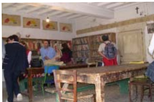
La sala che fungeva da classe per don Milani e i suoi alunni